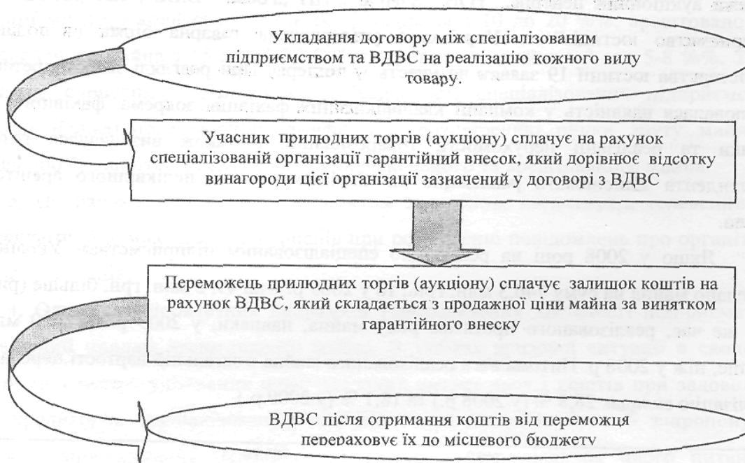
Рис. 1. Структурно-логічна схема поповнення місцевого бюджету при реалізації конфіскованого майна

Особливості діяльності спеціалізованих підприємств, які поповнюють місцевий бюджет у частині неподаткових надходжень при реалізації конфіскованого та арештованого майна, представлено на рис. 1 та рис. 2.