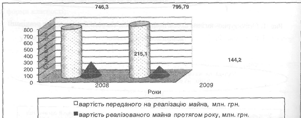
Рис. 3. Динаміка діяльності спеціалізованих підприємств за 2008-2009 рр.

Якщо у 2008 році на реалізацію спеціалізованим підприємствам України було передано майна на суму 746,3 млн. грн., то у 2009 р. – на 49,5 млн. грн. більше (рис. 3). У той же час, реалізованого протягом року майна, навпаки, у 2009 р. на 70,9 млн. грн. менше, ніж у 2008 р. Питома вага реалізованого майна в загальній вартості переданого на реалізацію складає 28,8 % (у 2008 р.) та 18,1 % (у 2009 р.)