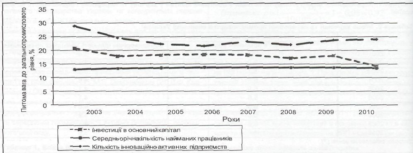
Рисунок 3. Питома вага харчової та переробної промисловості в промисловості України за 2003–2010 роки

Публічні інформаційні дані Державного комітету статистики України з великою мірою достовірності дозволяють побудувати такі тренди на підставі розрахунків питомої ваги харчової та переробної промисловості в економіці країни загалом за показником «інвестиції в основний капітал» протягом 2001–2010 років (це становить десять років) із викори-