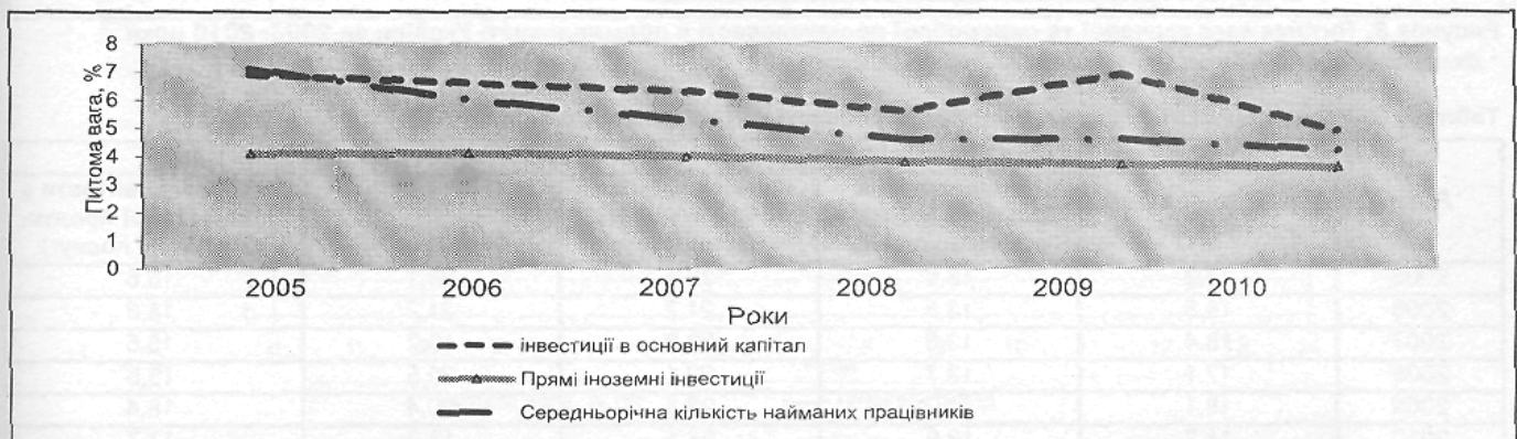
Рисунок 2. Питома вага харчової та переробної промисловості в економіці України за 2005–2010 роки*