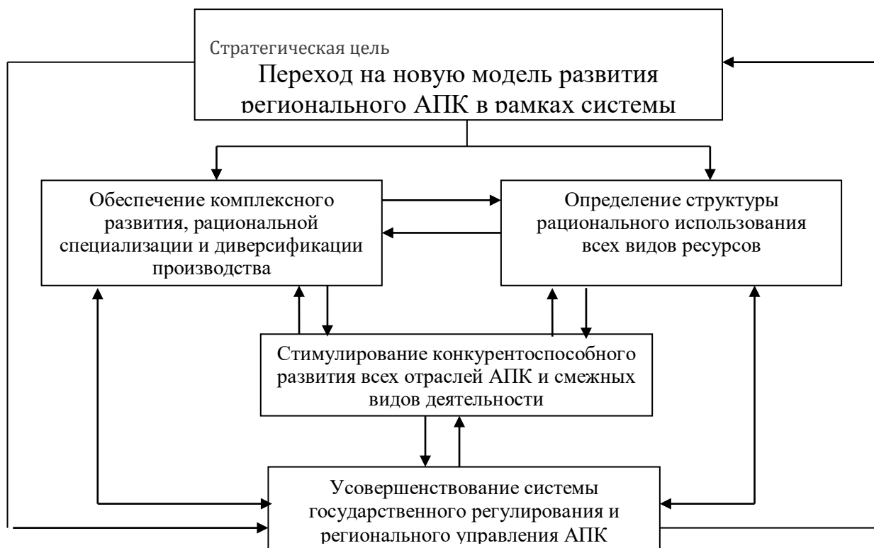
Рис. 1. Модель взаимодействия базовых задач программы развития регионального АПК

В основе модели будет лежать реализация последовательных действий-результатов: обоснованное решение → активизация инвестиционно-инновационной деятельности → обеспечение расширенного воспроизводства хозяйственных процессов в сельском хозяйстве и перерабатывающей сфере → повышение уровня жизни сельского населения → решение вопроса продовольственного обеспечения и безопасности. Указанные задачи и будут формировать соответствующую модель их взаимодействия (рис. 1).