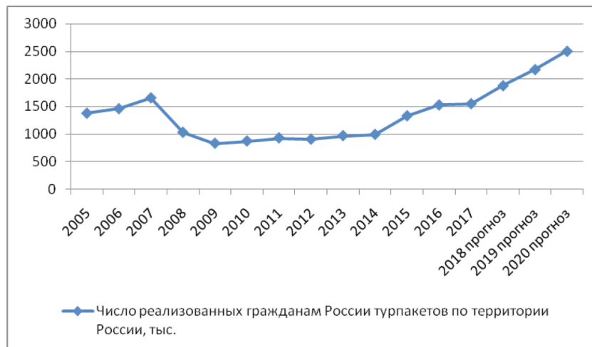
Рис. 4. Прогноз числа реализованных гражданам Российской Федерации турпакетов по территории России за 2005-2020 гг. [составлено автором на основе: 3]

Прогноз востребованности внутренних туристических услуг представлен на Рис. 4.