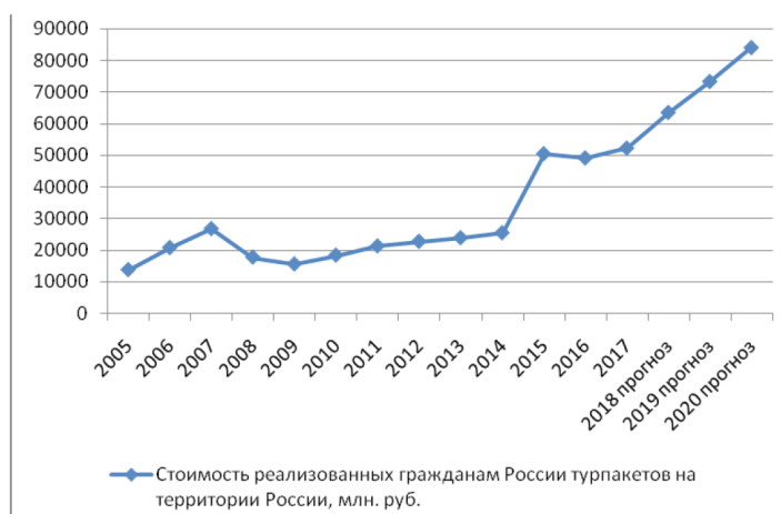
Рис. 2. Прогноз стоимости реализованных гражданам Российской Федерации турпакетов по территории России за 2005-2020 гг. [составлено автором на основе: 3]

Данные нижеприведенного Рис. 2 свидетельствуют о дальнейшем росте спроса на внутренний туристический продукт у граждан Российской Федерации.