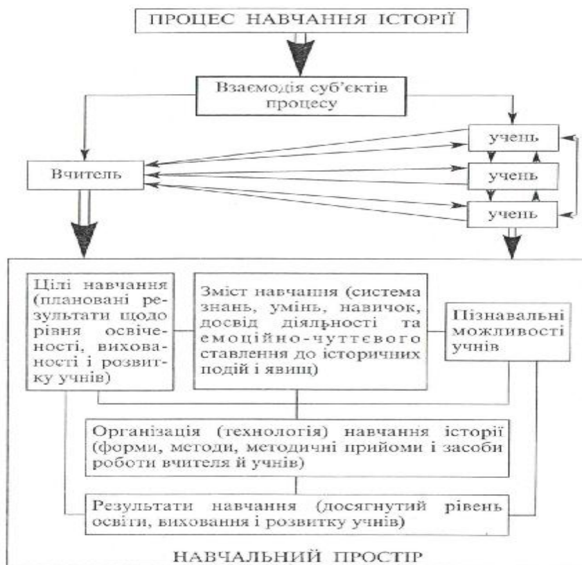
Схема 2. 1. Процес навчання історії та його основні компоненти (за О. Пометун)

Сучасне уявлення о взаємозв'язках головних компонентів (факторів) процесу навчання представлено у підручнику з методики О. І. Пометун [408, с. 14].