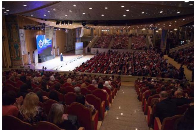
Торжественная церемония закрытия XXIV Рождественских образовательных чтений в зале Церковных Соборов Храма Христа Спасителя.