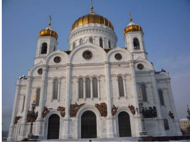
Храм Христа Спасителя г. Москва