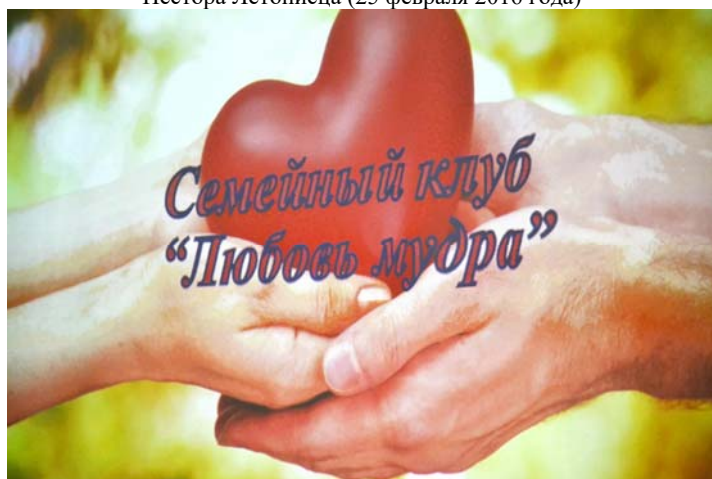
заседание семейного клуба «Любовь мудра» на тему «Как сохранить чистоту отношений» в духовно-просветительском центре им.св. преп. Нестора Летописца (25 февраля 2016 года)