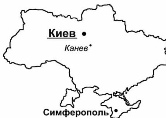
Рис. Местоположение изученного разреза

Костистые рыбы лютета платформенной Украины на сегодняшний день остаются не изученными. Настоящая работа посвящена описанию комплекса отолитов рыб из Костянецкого местонахождения.