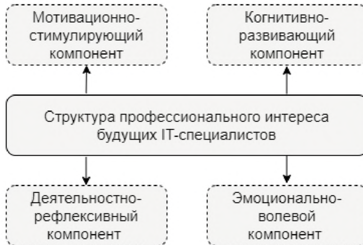
Рисунок 1 – Компонентный состав профессионального интереса будущих IT-специалистов

ность потребностей, мотивов, смысла и целей обучения, всего того, что составляет мотивационную сферу. Этот компонент характеризует внутренние побуждения будущего IT-специалиста, осознание им значимости процесса получения высшего образования, сочетаемое с внутренней мотивацией.