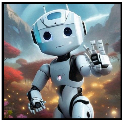
Рисунок 1. Робот-помощник

Ученики мыслят, запоминают, забывают. Они чувствуют, переживают, проявляют волю, упорство или, наоборот, мало работоспособны. У них формируются учебные навыки, умения, развиваются способности, интерес к окружающему миру, формируются качества личности. Роботизация учебного процесса позволит взглянуть на систему образования под другим, совершенно новым углом. Учебные заведения перестанут казаться для обучающихся чем-то страшным и скучным, ведь в наше время личность должна быть заинтересована и только тогда будет результат, не просто желание учиться, а творить что-то новое. Стоит лишь представить, насколько учебный процесс станет увлекательнее с роботами, голографическими проекторами и прочими разработками нашего века, которые можно и нужно интегрировать в систему образования.