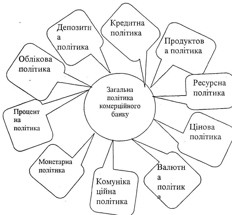
Рис. 1. Складові політики комерційного банку (розроблено авторами)

За своїм змістом політика комерційного банку складає сукупність елементів, кожний з яких, як це ілюструється рисунком 1, є однією із складових загальної політики комерційного банку.