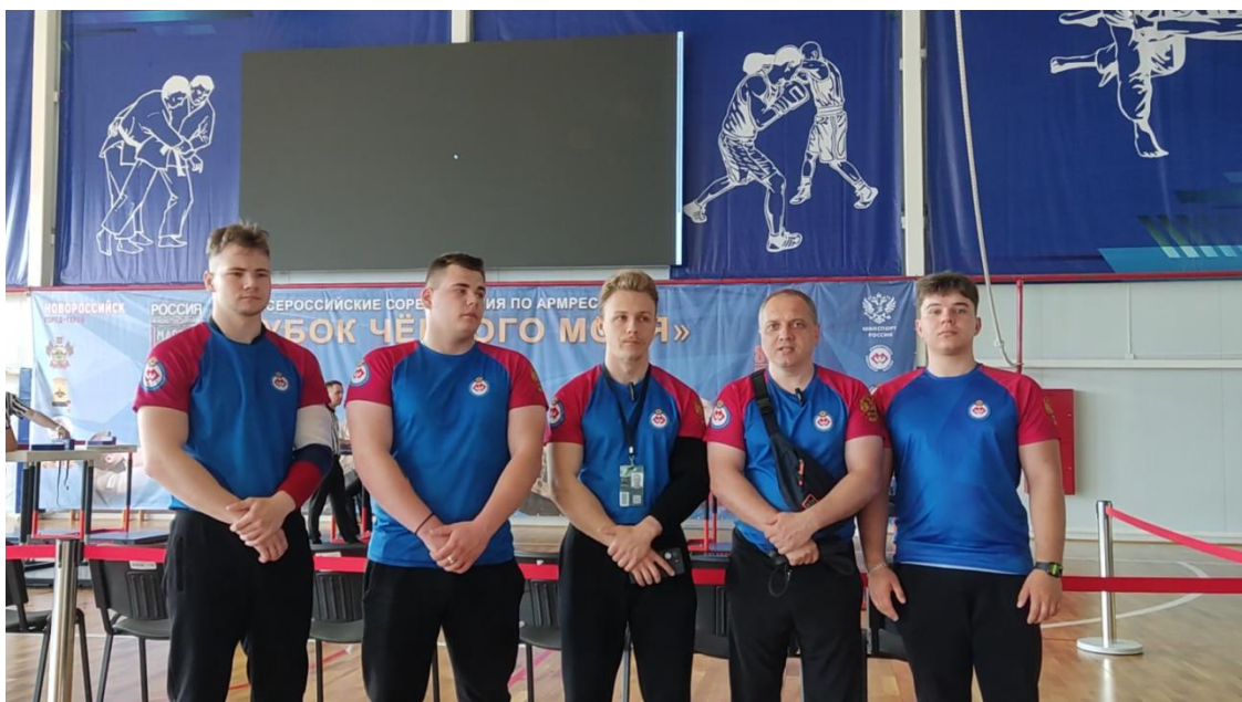
Фото 3. Пищевые добавки и спортивное питание в армрестлинге (31 мая 2025 года. Город Новороссийск. Кубок Чёрного моря по армрестлингу (29.05-02.06.2025)).