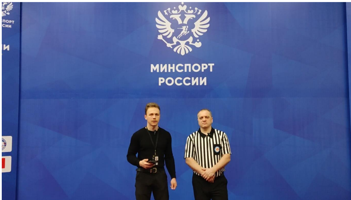
Фото 1. Онлайн-курс «Антидопинг. 2025» (18 марта 2025 года). Город Орёл. Первенство России по армрестлингу (16.03-21.03.2025).

Во исполнение поручения Минспорта ЛНР, на основании методических рекомендаций по совершенствованию механизмов ведения антидопинговой политики в субъектах Российской Федерации, общероссийских спортивных федерациях и региональных спортивных федерациях, а так же согласно плану антидопинговых мероприятий в 2025 году Федерации армрестлинга Луганской Народной Республики проведено четыре антидопинговых информационно-образовательных мероприятия (см. фото 1 – 4).