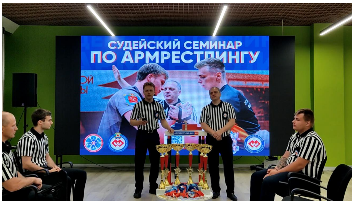
Фото 4. Роль тренеров и родителей в процессе формирования антидопинговой культуры спортсменов в армрестлинге (15 июня 2025 года. Республиканские соревнования (арм-файты) по армрестлингу среди мужчин и женщин, приуроченных Дню России).

Заключение. Итак, антидопинговое обеспечение спортивных мероприятий в Луганской Народной Республике, которое осуществляется в соответствии с Общероссийскими антидопинговыми правилами на 2025 год выполнено в полном объёме. Все Федерации армрестлинга Луганской Народной Республики прошли образовательный курс «Антидопинг» на платформе РУСАДА (портал онлайн-образования РУСАДА).