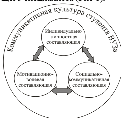
Рис. 1. Теоретико-экспериментальная модель структуры коммуникативной культуры будущего специалиста.

Все вышеупомянутые составляющие не имеют иерархической структуры, взаимодополняют друг друга и, в свою очередь, влияют на коммуникативную культуру личности, что дало основание для создания теоретико-экспериментальной модели структуры коммуникативной культуры будущего специалиста (Рис 1).