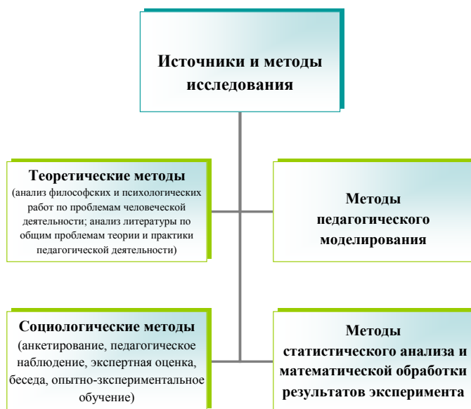
Рисунок 2 – Источники и методы проводимого исследования

На первом поисково-теоретическом этапе (2015г.) в процессе теоретического осмысления темы нами была изучена философская, психолого-педагогическая литература, диссертационные исследования, определялись методологические и теоретические основы исследования. Анкетирование, собеседование, метод экспертной оценки позволили определить имеющийся уровень готовности студентов к профессионально-педагогической деятельности.