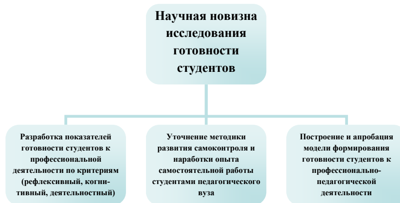
Рисунок 3 – Научная новизна проводимого исследования

Научная новизна проводимого нами исследования представлена на рисунке 3.