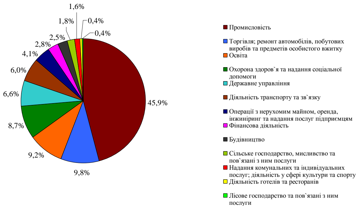
Рис. 1. Зайнятість молоді за видами економічної діяльності в Луганській області, % (за станом на 31 грудня 2010 р.)