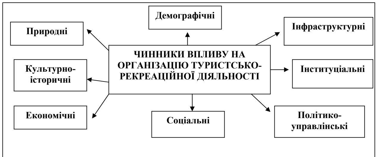
Рис. 1. Чинники впливу на: організацію туристсько-рекреаційної діяльності (авторська інтерпретація)

Безпосередній вплив на організацію туристсько-рекреаційної діяльності у межах територій локального рівня здійснюють природні умови - рельєф, клімат, поверхневі та ґрунтові води, рослинний та тваринний світ тощо.