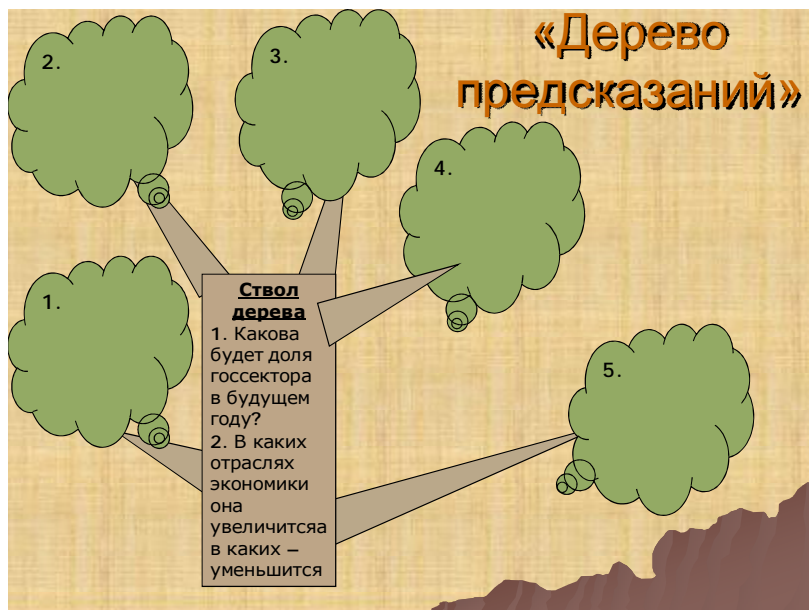
Рис. 1. Дерево прогнозов

Студентам предлагается составить дерево прогнозов (предсказаний) (рис. 1).