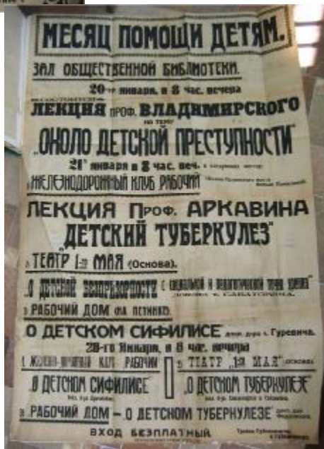
Оголошення про початок місяця допомоги дітям