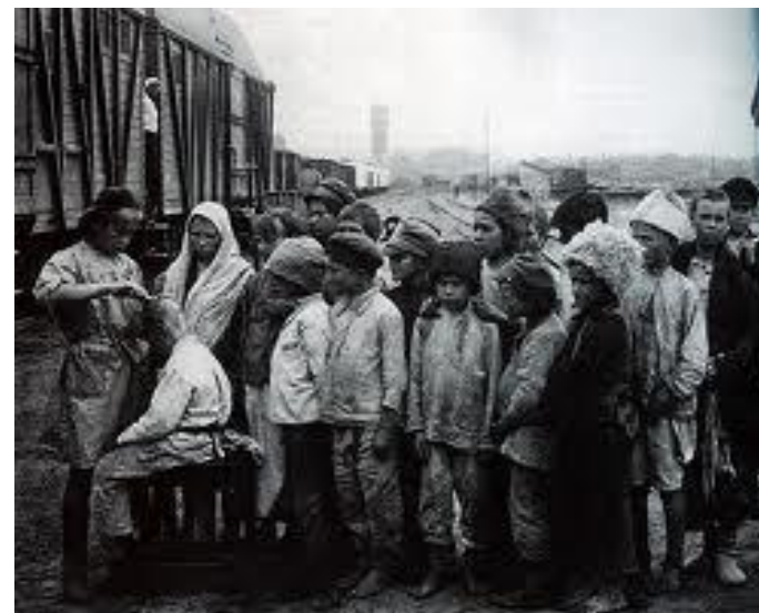
Санітарна обробка безпритульників