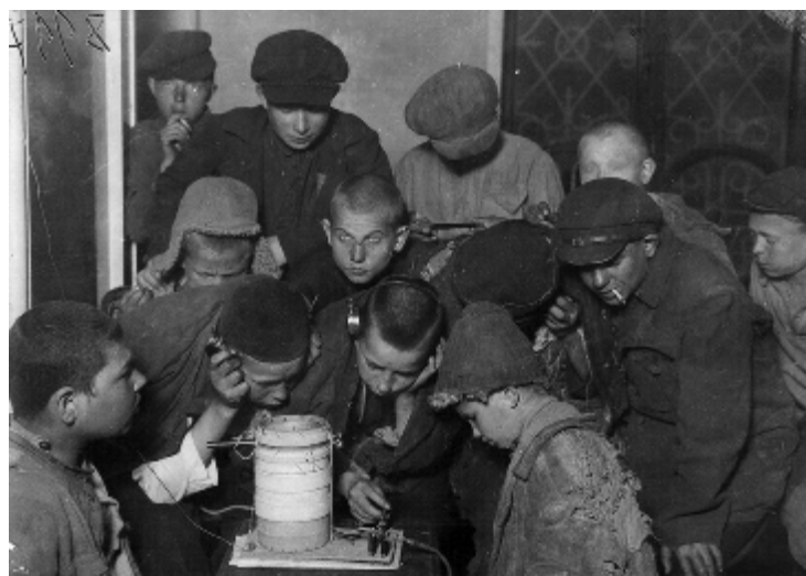
Безпритульники у гуртожитку слухають радіоприймач. Москва, 1925 рік