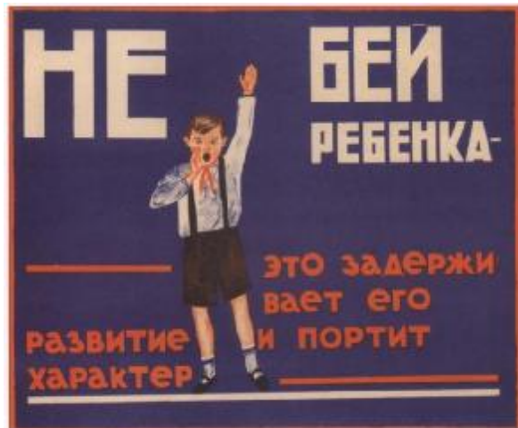
Плакат «Не бий дитину, це затримує її розвиток і псує характер». А. Лантєв. 1929 рік