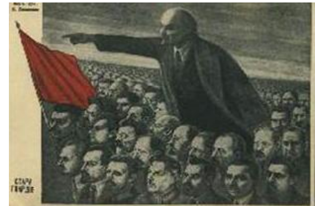
Такі листівки та зображення з портретом В. Леніна випускало товариство «Друзі дітей» з благодійною метою