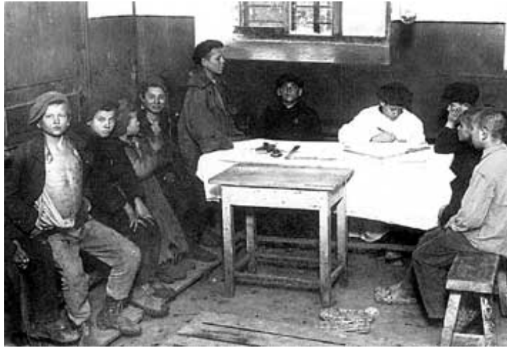
Запис безпритульників у колектор. 1920-і роки