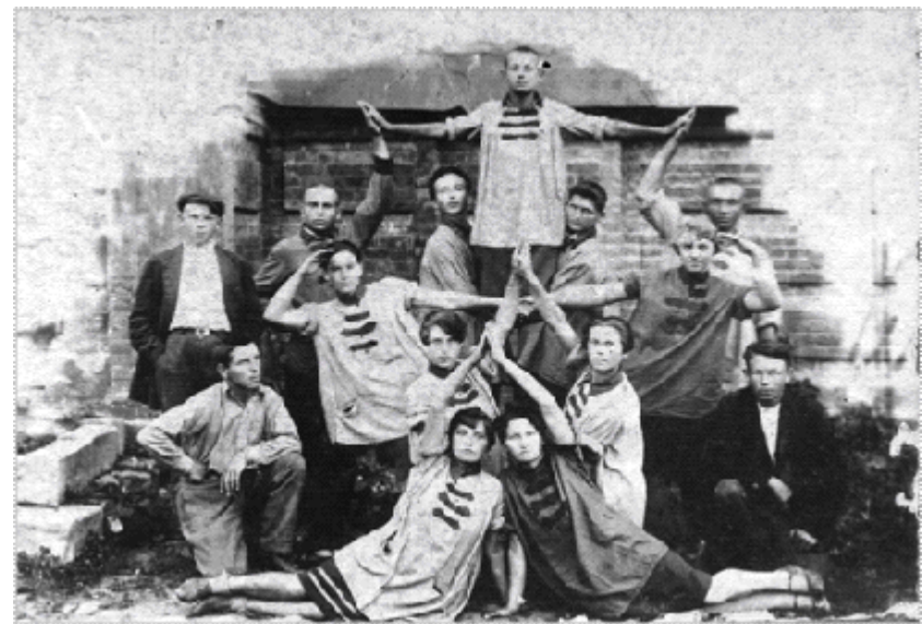
Виступ колективу «Синя блуза» Слов'яносербщини. 1929 р.