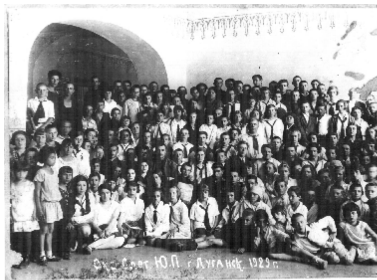
Окружний з'їзд юних піонерів. Луганськ. 1929 рік