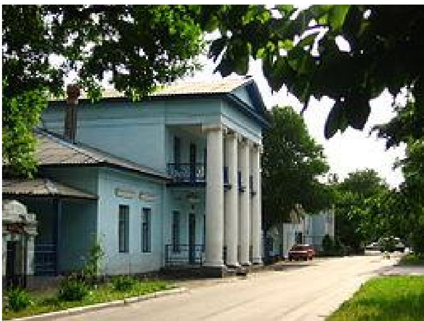
Так сьогодні виглядає цей будинок