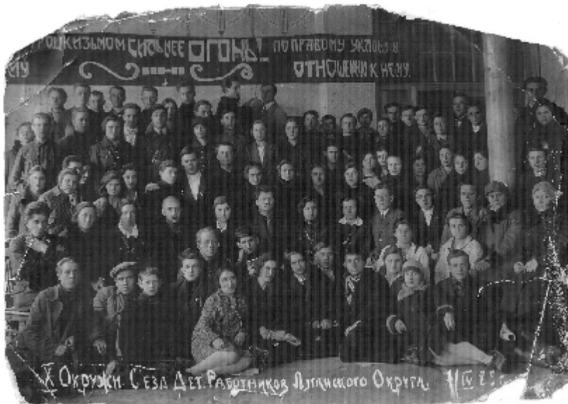
X окружний з'їзд дитячих працівників Луганського округу. 1929 рік