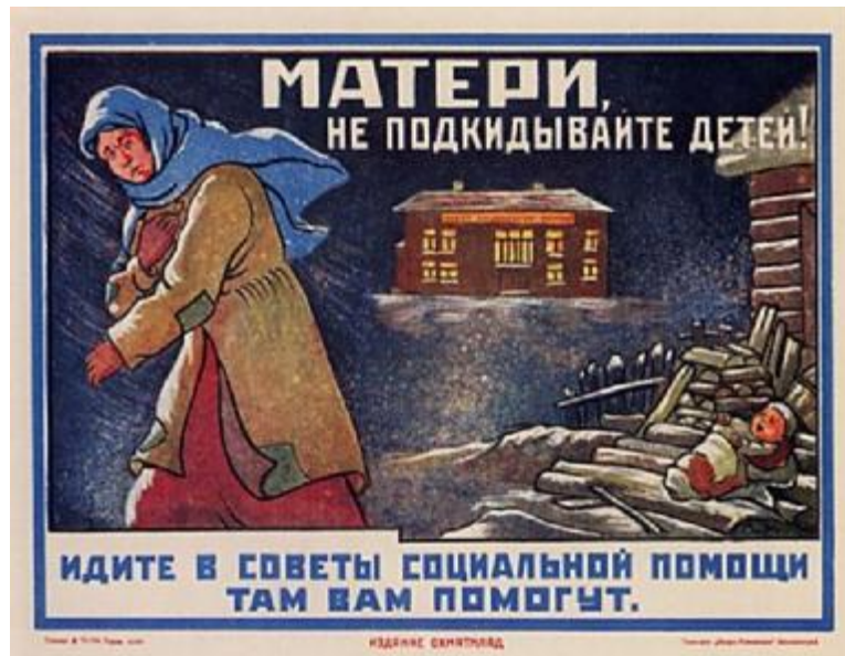
Плакат «Матері, не підкидайте дітей!» А. Соборова. 1925 рік