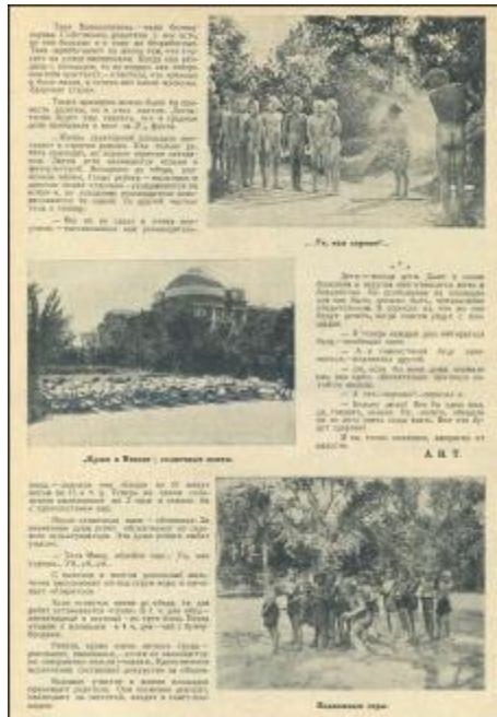
Сторінки із газети «Друг дітей»