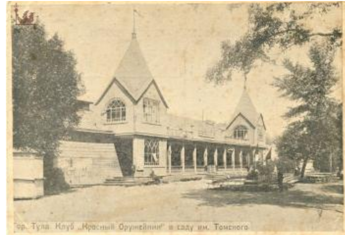
г. Тула. Клуб „Красный Оружейник” в саду им. Томского