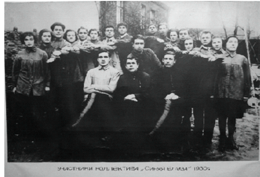
Учасники колективу «Синя блуза» 1930.