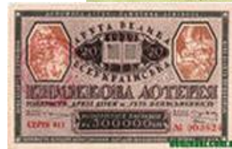
Книжкові лотереї, кошти від продажу яких йшли на боротьбу з дитячою безпритульністю. 1930 – 1931 роки