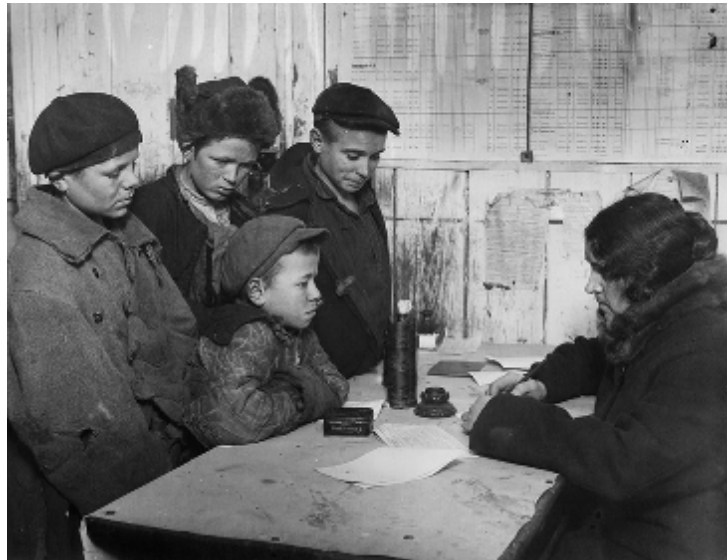
Реєстрація безпритульних у кімнаті школи для безпритульних Московського відділу народної освіти. Москва. 1928 р. 1