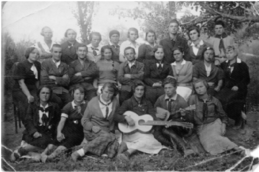
Семинар піонервожатих Біловодського району. 1936 рік