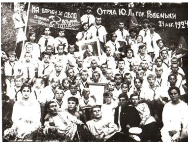
Перші піонери м. Ровеньки 1924 рік