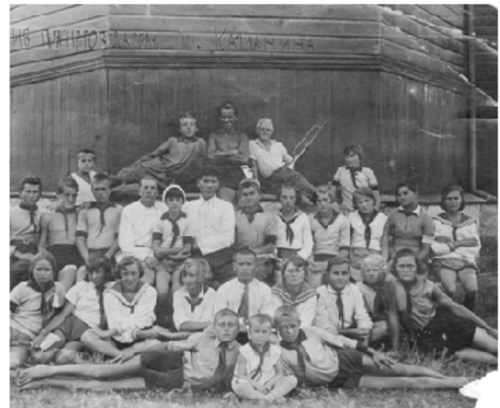
Актив піонерського табору імені Каманіна. Село Великий Суходол. 1934 рік