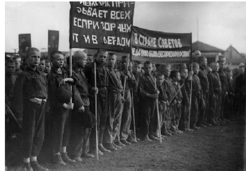
Безпритульники на параді. 1925 рік 1