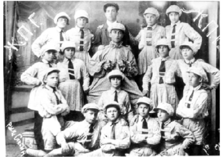
«Жива» піонерська газета м. Червоний Луч. 1930 рік