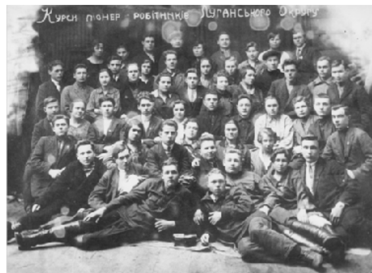
Курси піонерських робітників Луганського окружного комітету комсомолу