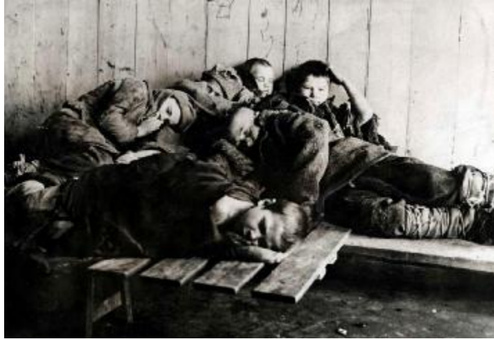
Безпритульники на ночівлі. 1920-і роки