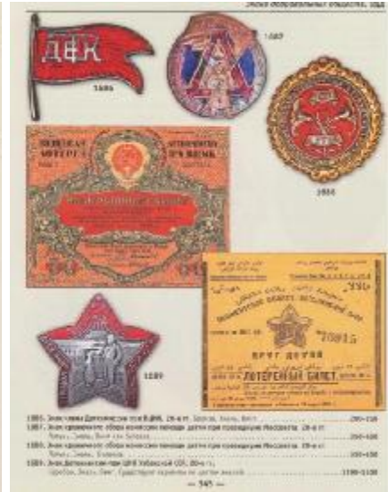
Значки та лотерейні білети добровільного товариства «Друг дітей»