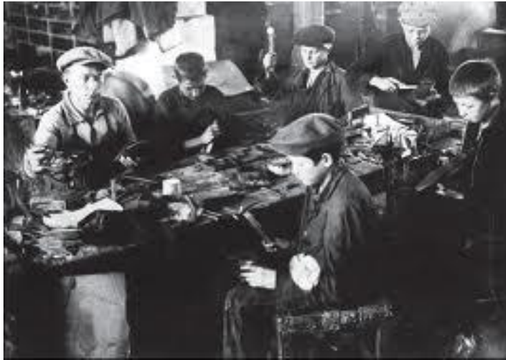
Навчання вихованців у дитячій комуні. 1930-і роки