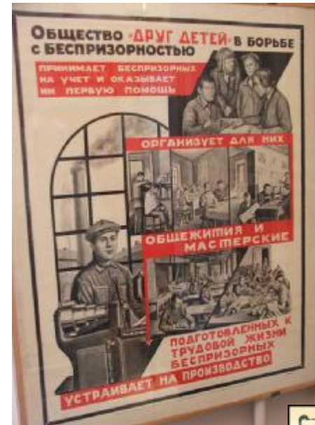
Плакат із квартири-музея С. Кірова, присвячений боротьбі з безпритульністю товариства «Друзі дітей»