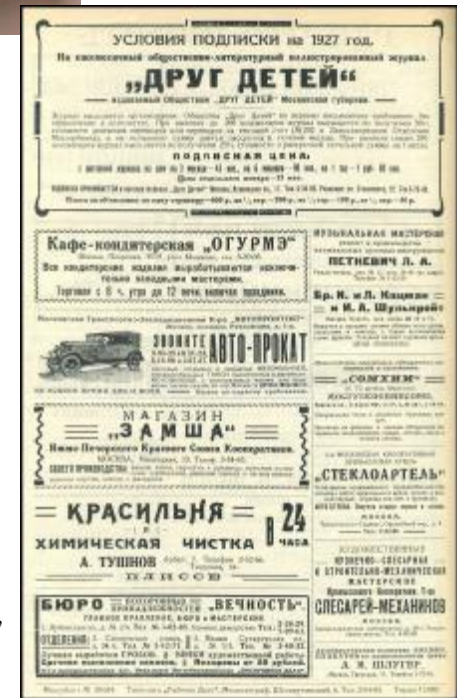
Реклама підписки на газету «Друг дітей»