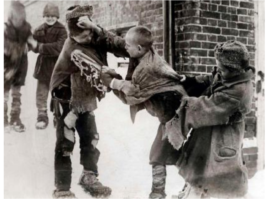
Бійка безпритульників. 1920-і роки