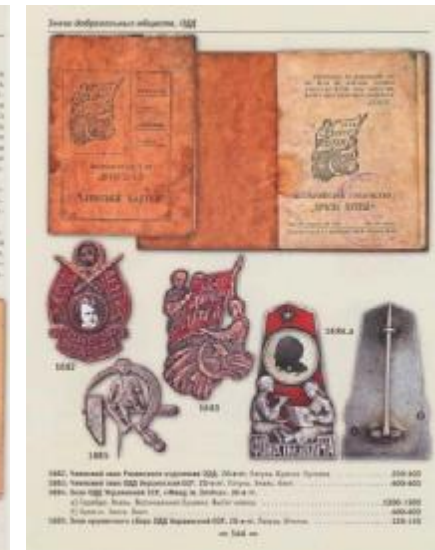
Брошури, членські квитки та інша атрибутика добровільного товариства «Друг дітей»