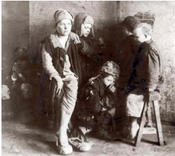
Повсякденне життя дітей вулиці. 1920-і роки