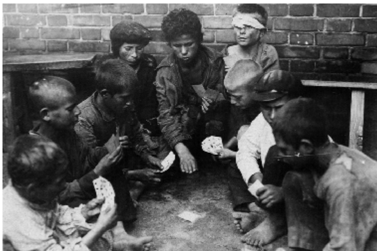
Безпритульники за ігрою в карти. 1925 рік