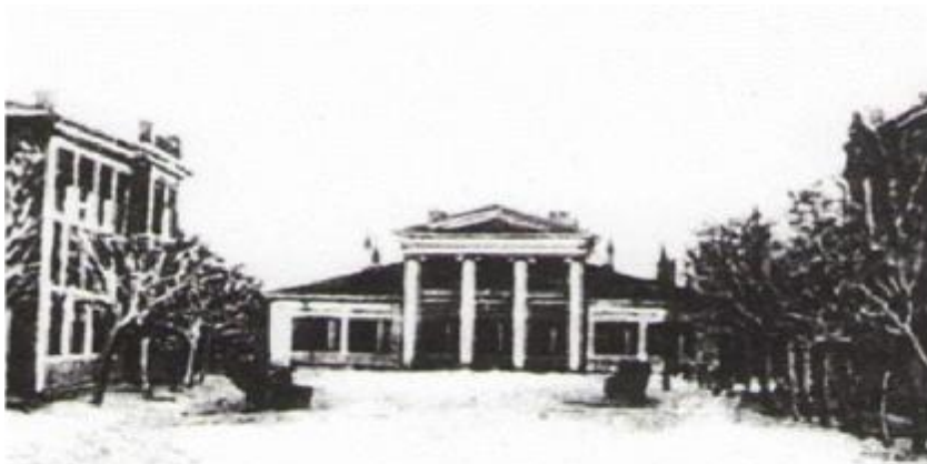
У приміщенні луганської водолікарні розташовувався дитячий будинок страхової каси в 1923 – 1924 роках