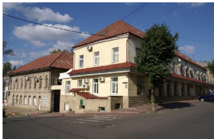
Так сьогодні виглядає цей будинок на площі імені Борців Революції