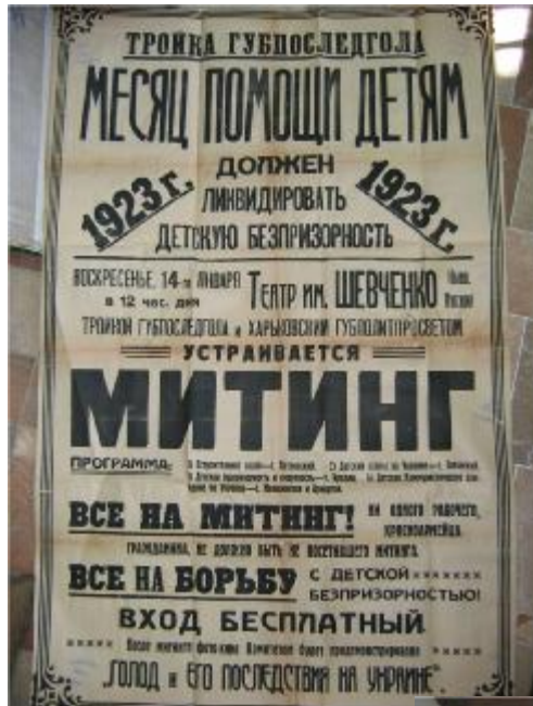
Оголошення про мітинг з приводу боротьби з безпритульністю