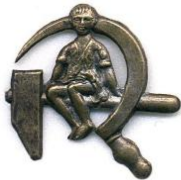
Значки товариства «Друг дітей»