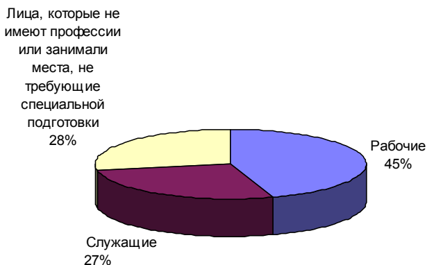
Рисунок 1 – Состав незанятого населения на 01.02.2017 г.

Исходя из таблицы 2 основную долю незанятого населения составляют рабочие специальности, в структуре имеющихся свободных рабочих мест основную долю тут занимают служащие.