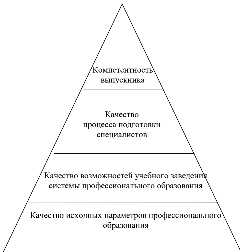
Рис. 1. Пирамида качества профессионального образования

выстраиваются учебные дисциплины, реализуемые в тех или иных формах обучения.