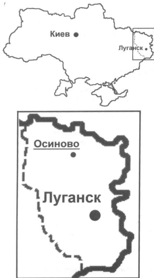
Рис. 1. Местоположение изученного разреза

На размытой поверхности белых мергелей верхнего мела залегают: