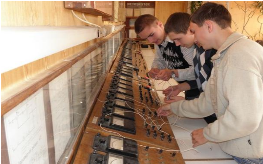
Студенти-електрики під час виконання лабораторної роботи