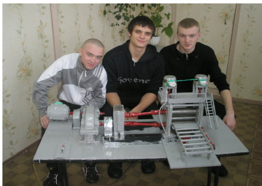
Модель головної лінії кліті тріо Лаута зі столом, що підйомно-гойдається

Загалом же потреба в творчості може бути визначена як глибинна характеристика людської сутності. Творчість можна сформулювати тільки творчістю, а творча думка може бути передана від людини до людини тільки у процесі безпосередньої творчої взаємодії. Тому надзвичайно високою у майбутній вітчизняній школі має стати роль творчої особистості викладача, причому не просто дипломованої особи, а науковця, митця, суспільного діяча.