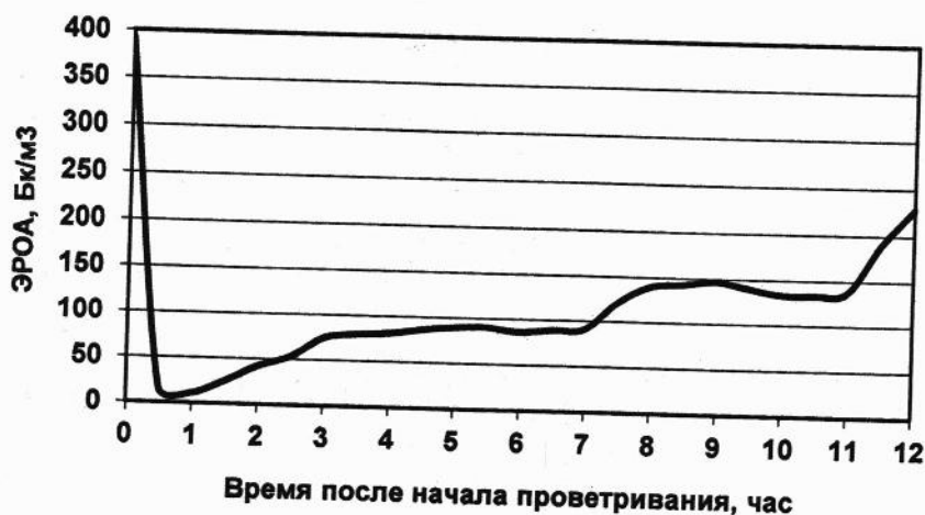
Рис. 2. К оценке эффективности естественной вентиляции

3. Изменение активности радона в воздухе помещений носит сложный аperiodический характер, мало согласующийся с изменением разности температур воздуха снаружи и внутри помещения.