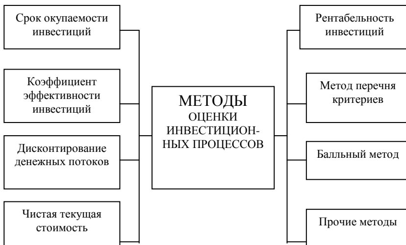
Рисунок 1 – Методы оценки инвестиционных проектов