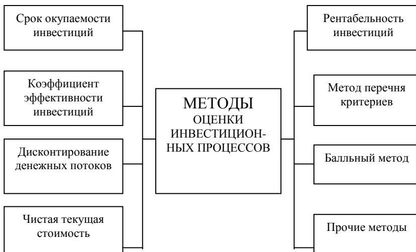
Рисунок 1 – Методы оценки инвестиционных проектов