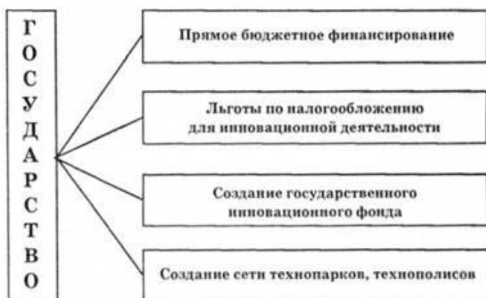
Рис.1. Методы стимулирования инновационной деятельности

Рассмотрим такой широко применяемый государствами метод стимулирования как налоговый.