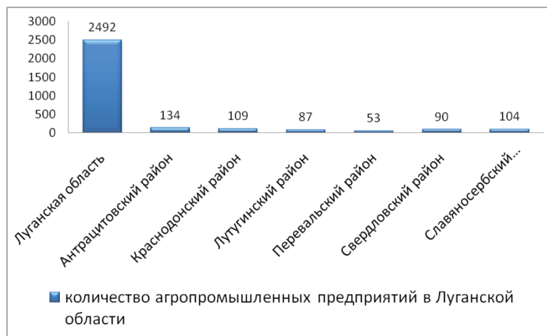
Рис. 2. Сравнение количества агроформирований в Луганской области и районах, вошедших в состав ЛНР, в довоенный период

По данным Государственного комитета статистики Луганской Народной Республики, сельскохозяйственную деятельность осуществляют 307 предприятий всех форм собственности, 10,7 тысяч домохозяйств общей площадью земельных участков 11,9 тыс. га.вчсч