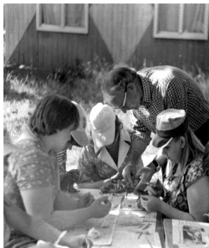
Учебно-полевая практика. Обработка полевого материала, биостанция ЛГПИ в Новой-Ильенко. 1985 г.