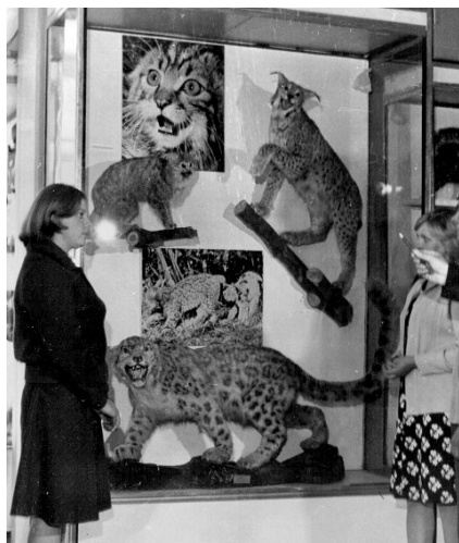
Зачет по зоологии у студентов отделения география-биология в зоологическом музее университета. 1978 г.