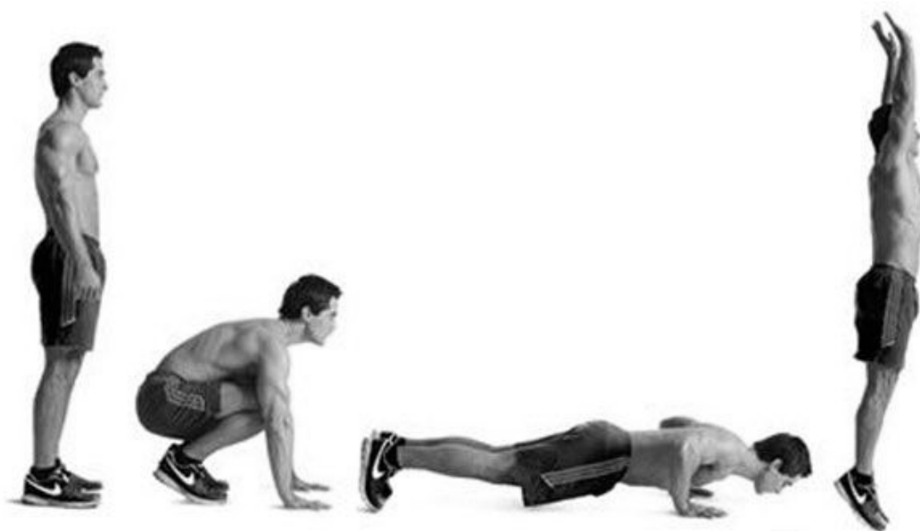
Рисунок 1 – Бёрпи для юношей