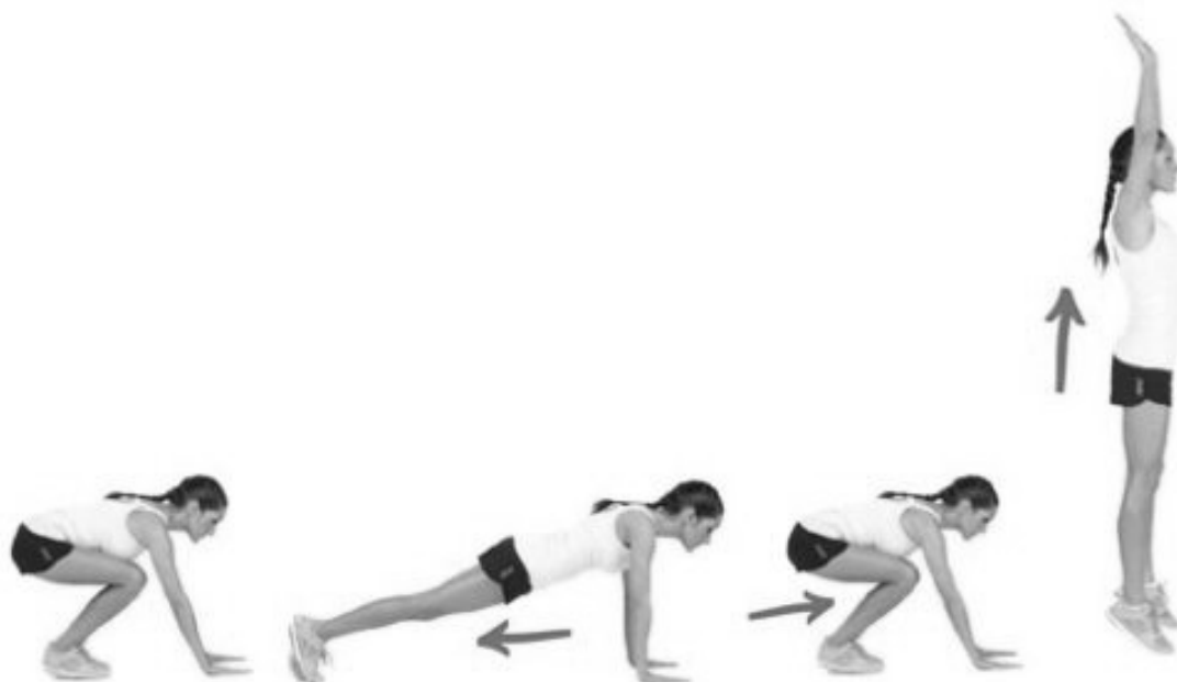
Рисунок 2 – Бёрпи для девушек