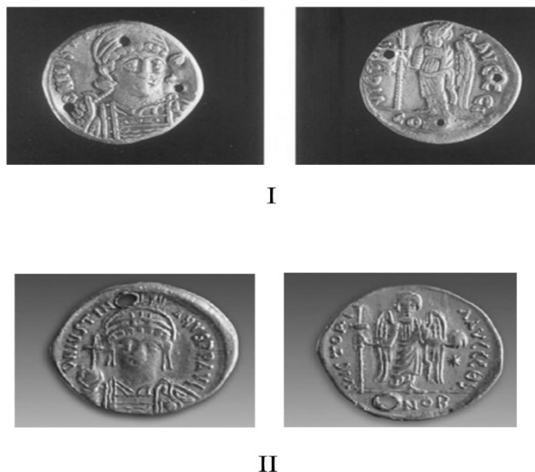
Рисунок 1: I – золотая монета Юстина I (вероятно, качественная имитация) из погребения Тянь Хуна (эпоха Северная Чжоу, округ Гуюань, Нинся-Хуйэский АР, КНР), подобная той, что была обнаружена в погребении 2004YKJM4 могильника Цзюлуншань (эпоха Суй, округ Гуюань, Нинся-Хуйэский АР, КНР). 1 – аверс 2 – реверс (даётся по: Ло Фэн, 2004. С. 136).

Погребение 2004YKJM33 (также M33) расположено на южной стороне могильника. Из-за проводившейся здесь хозяйственной деятельности стратиграфия захоронения нарушена. Вход в могилу прослеживается примерно на глубине 60 см. Гробница представляет собой погребальную камеру с дромосом, общей длиной 8,2 м. Усопших двое, они лежат рядом вытянуто на спине, головами на юго-восток, боком ко входу в погребальную камеру. В захоронении была найдена золотая монета (индекс M33: 4). Форма монета округлая, с обрезанными краями. В верхней части имеется округлое отверстие (очевидно, для нашивания или подвешивания). На аверсе мы видим погрудный портрет восточно-римского императора со шлемом на голове, в доспехах. В приподнятой к плечу руке басилевса «держава» – шар с крестом. Надпись на монете слегка повреждена при проделывании отверстия. Справа от портрета государя «DNIVSTIN», слева – «ANVSPPAVI». На реверсе крылатая фигура Ники (или ангела) с крыльями, в правой руке длинный крест, в левой – шар с крестом (держава), под которым находится восьмиугольная звезда. Надписи на реверсе: «VICTORI» справа и «AAVGGGΘ» слева, затем литера «S», а внизу надпись «... NOB». Диаметр 1,8 см, толщина 1 мм, масса 3 г. Эта золотая монета подобна солидам императора Восточной Римской империи Юстиниана I Великого (527–565 гг) (рис. 1 – II) [7].