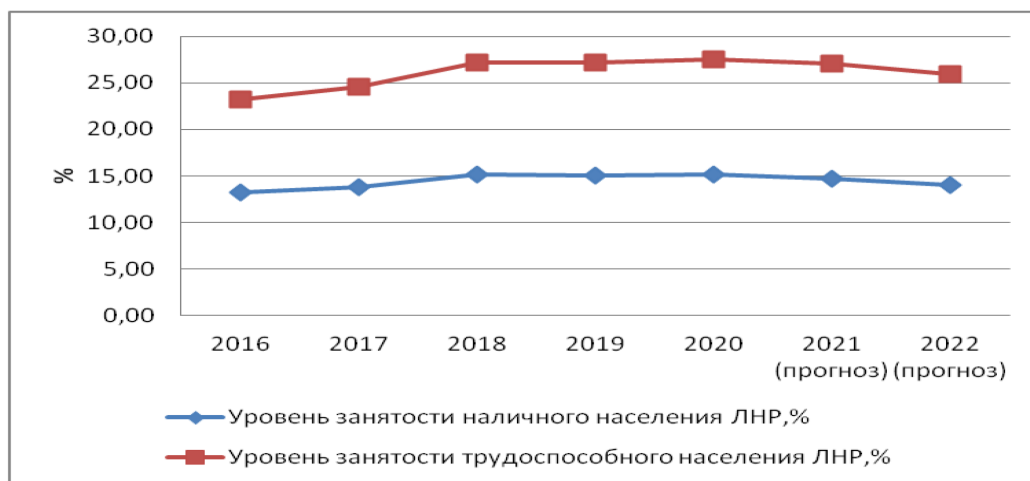
Рисунок 1 – Динамика уровня занятости населения ЛНР за 2016-2020 годы и прогноз на 2021-2022 годы, % [составлено автором на основе: 3;4]

Отообразим результат прогнозирования на рис. 1.