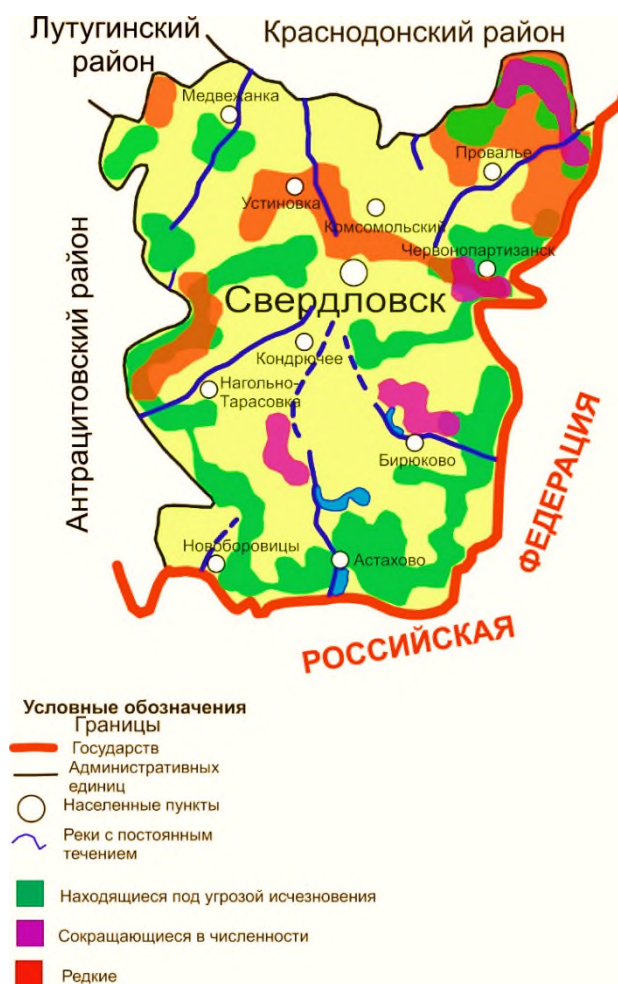
Рис. 2. Флористическое районирования редких и исчезающих видов растений Свердловского района Луганской Народной Республики (составлено авторами по данным [3; 4])

Имеется много способов защиты и сохранения биологического разнообразия. На уровне видов выделяются два основных стратегических направления: в месте и вне места обитания. Охрана биоразнообразия на уровне видов – дорогой и трудоемкий путь, возможный только для избранных видов, но недостижимый для охраны всего богатства жизни. Главное направление стратегии должно быть на уровне экосистем, чтобы планомерное управление экосистемами обеспечивало охрану биологического разнообразия на всех иерархических уровнях.