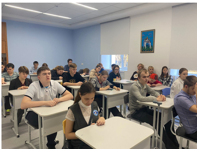
Рис. 23. Мастер-класс по организации инклюзивных социокультурных проектов для незрячих и слабовидящих детей школы-интерната им. С. А. Мартиросяна