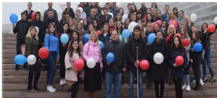
Рис. 22. Акция «Внимание! Белая трость!» на пешеходных переходах города

Основной функцией волонтера-плеймейкера на этом этапе является организация инклюзивного взаимодействия. Во-