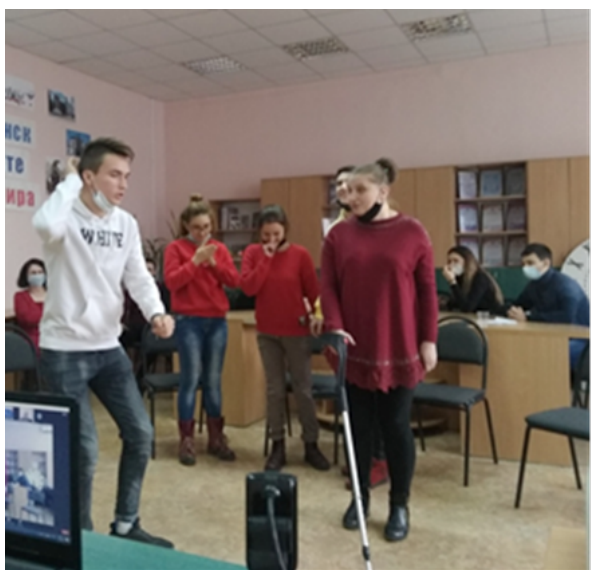
Рис. 26. Выступление студентов кафедры адаптивной физической культуры и физической реабилитации (актёров инклюзивного Playback )