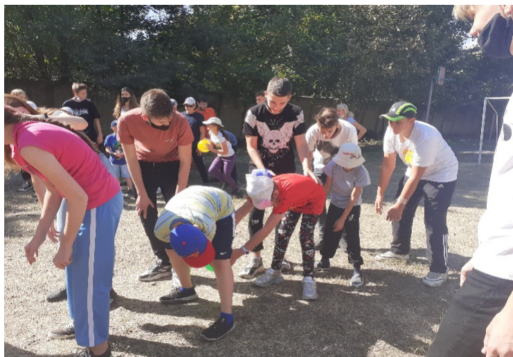
Рис. 24. Участие волонтеров (студентов инклюзивных групп) в спортивных мероприятиях и учебных занятиях детей