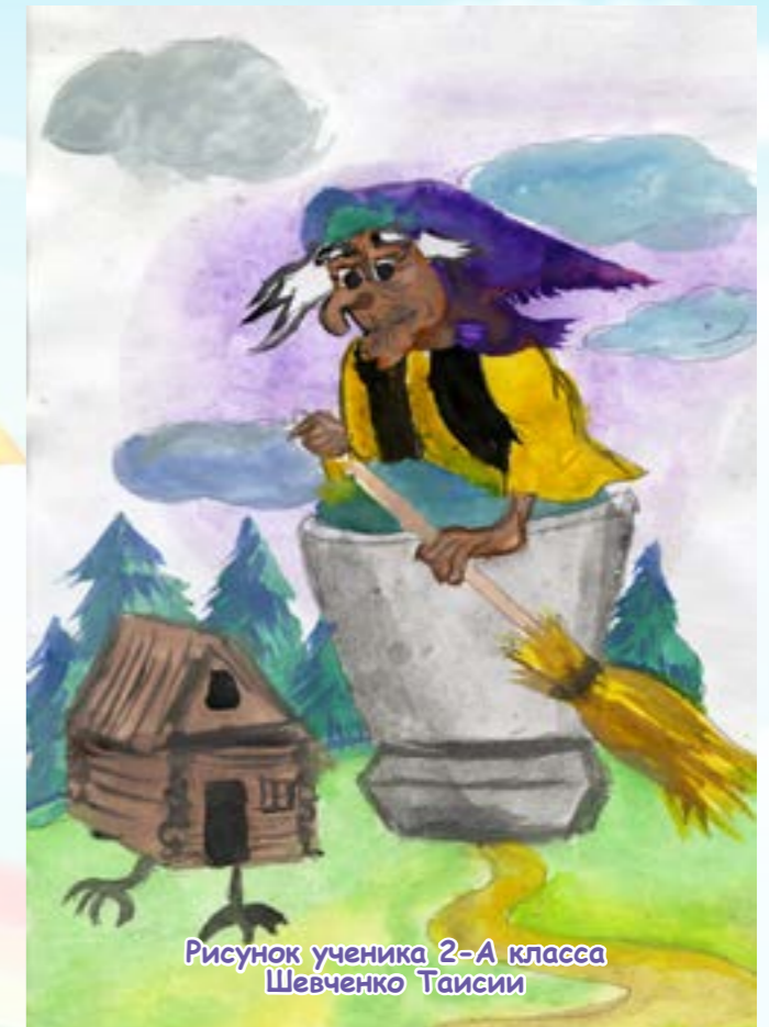
Рисунок ученика 2-А класса Шевченко Таисии