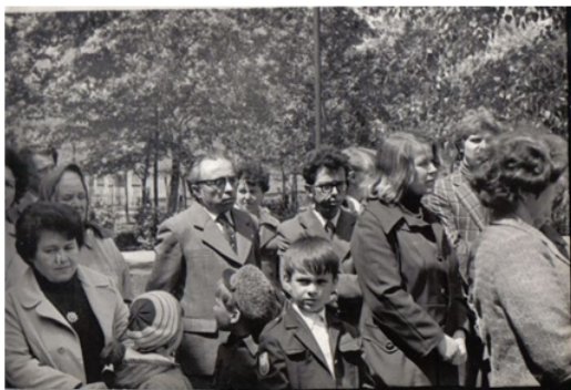
24.05.1980, СШ № 36, последний звонок.

сущность каких-либо процессов, оперируют такими понятиями, как «закон», «явление», «закономерность» и т.п., не понимая их значения. Им были предприняты попытки наверстать упущенное на своих уроках, однако это не возымело положительного эффекта, т.к. такая работа носила односторонний характер, что привело его к идее о привлечении учителей других дисциплин. Таким образом,