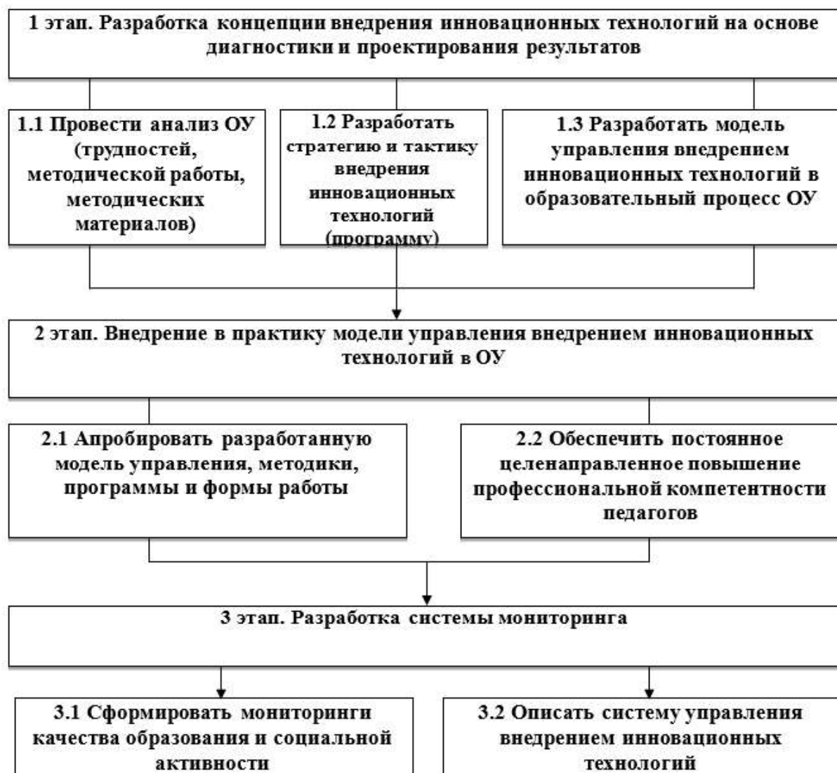
Рис. 1. Алгоритм внедрения инновационных технологий в образовательный процесс ОУ

1 этап. Разработка концепции внедрения инновационных технологий на основе диагностического и результирующего проектирования.