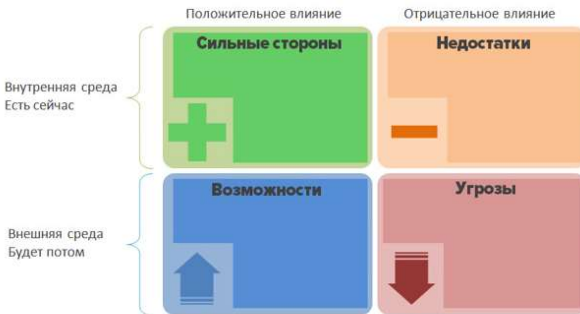
Рис. 2. SWOT-анализ

SWOT-анализ позволил выявить сильные и слабые стороны (внутренние факторы), перспективные возможности и риски развития (внешние факторы) гимназии [3].