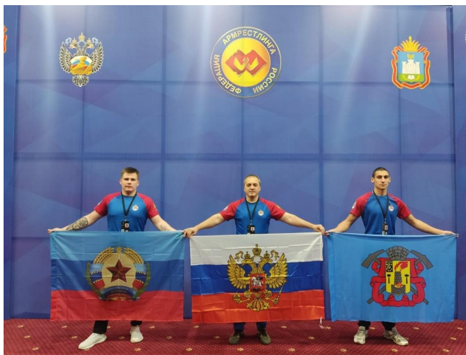
Фото 12. Сборная команда Федерации Армрестлинга ЛНР на Всероссийских соревнованиях по армрестлингу среди юниоров в городе Орёл (4–8 декабря 2023 года)