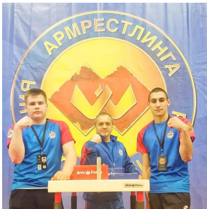
Фото 13. Сборная команда Федерации Армрестлинга ЛНР на Всероссийских соревнованиях по армрестлингу среди юниоров в городе Орёл (4–8 декабря 2023 года)