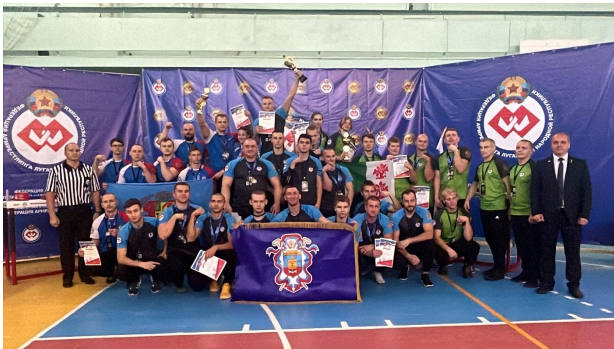
Фото 6. Первый Кубок Луганской Народной Республики по армрестлингу (15 октября 2023 года)