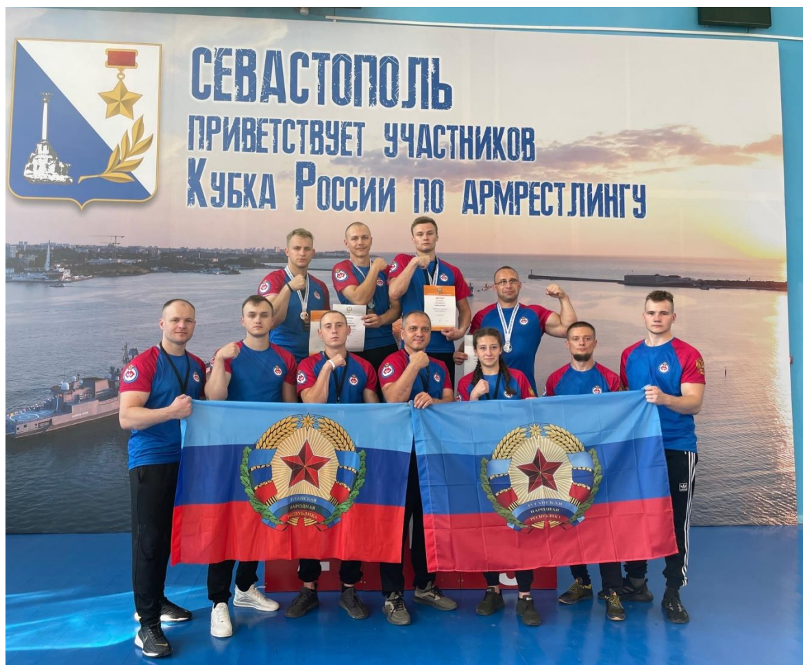
Фото 1. Сборная ЛНР на Кубке России по армрестлингу в городе Севастополь (21.09.2023 – 25.09.2023)