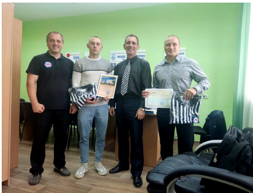
Фото 7. Вручение удостоверений и свидетельств в ИФВС прохождения дистанционных краткосрочных курсов повышения квалификации по программе «Современные технологии организации и судейства соревнований в армрестлинге» в Белгороде с 9 октября по 21 октября 2023 года

были вручены судейские майки и ремни для судейства поединков на соревнованиях по армрестлингу (см. фото 7).