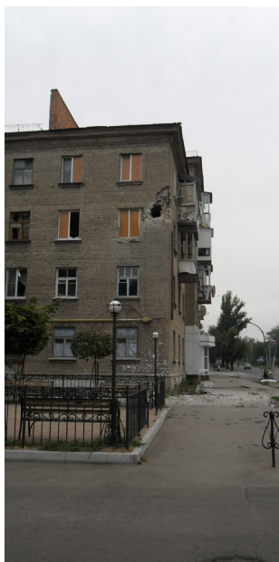
г. Луганск (Храм «Умиление»