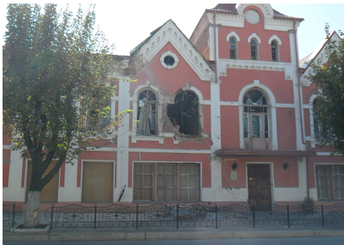
г. Луганск (ул. К. Маркса)