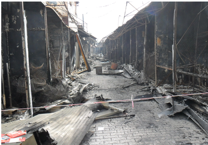
г. Луганск (Центральный рынок)