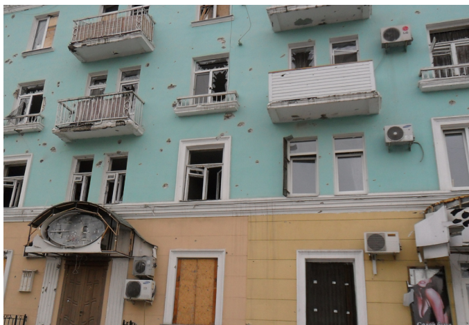
г. Луганск (ул. Советская)