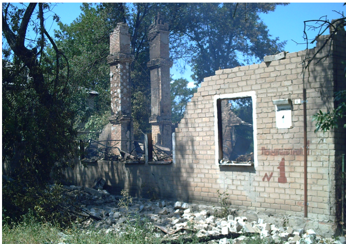
г. Луганск (ул. Цимлянская)