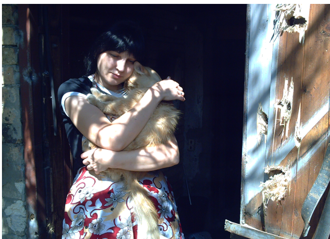
г. Луганск (ул. Таллинская)