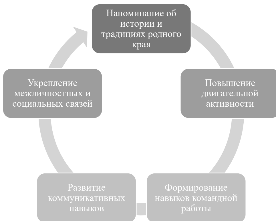
Рисунок 2.2.1 Причины, по которым целесообразно включать народные игры в физкультурный процесс детей в условиях дошкольного учреждения

Исходя из вышеизложенного, можно выделить пять причин, по которым целесообразно включать народные игры в физкультурный процесс дошкольников детей в условиях дошкольного учреждения (Рисунок 2.2.1):