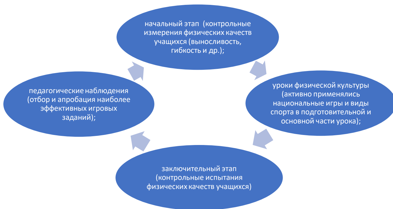
Рисунок 4.2.1. Этапность системного подхода при реализации программы применение народных игр (В. А. Еремин)

Рассматривая авторские программы, обратили внимание на многообразие игр представленных в них.